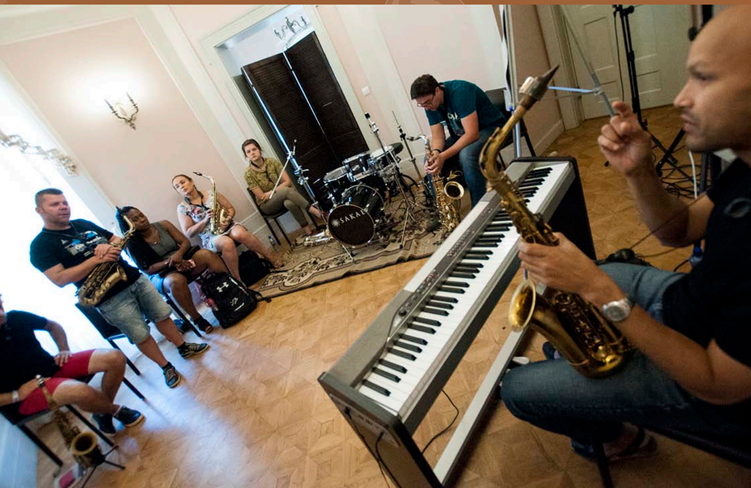
New York Jazz Masters International Workshop, Wojanów 2018